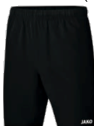
CLASSICO Shorts Artikel-Nr.: 6250 Farbe: schwarz Größen: 116-164 / S-4XL