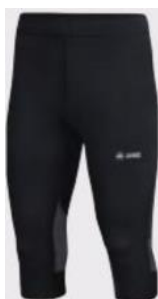
Capri Run 2.0 Artikel-Nr.: 6726 Größen: 128-164; S-XXL; 34-44 (Damenschnitt)