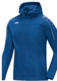
CLASSICO Kapuzenjacke Artikel-Nr.: 6850 Farbe: royal Größen: 128-164; S-4XL