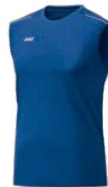
CLASSICO Tanktop Artikel-Nr.: 6050 Größen: S-XXL