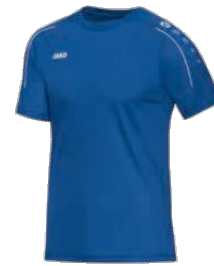
CLASSICO T-Shirt Artikel-Nr.: 6150 Farbe: royal Größen: 116-164; S-4XL