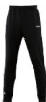
CLASSICO Polyesterhose Artikel-Nr.: 9250 Farbe: schwarz Größen: 116-164; S-4XL