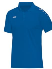
CLASSICO Polo Artikel-Nr.: 6350 Farbe: royal Größen: 140-164 / S-4XL