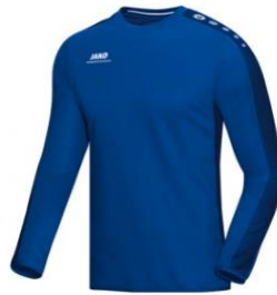
CLASSICO Sweat Artikel-Nr.: 8850 Farbe: royal Größen: 116-164; S-XXL