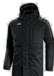
CLASSICO Coachjacke Artikel-Nr.: 7150 Farbe: royal; schwarz