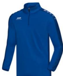
CLASSICO Ziptop Artikel-Nr.: 8650 Farbe: royal Größen: 128-164 / S-3XL