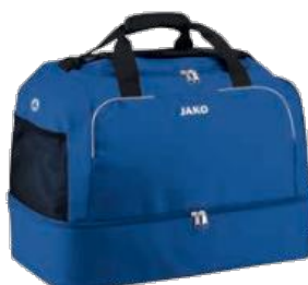
CLASSICO Tasche m. Bodenfach Artikel-Nr.: 2050