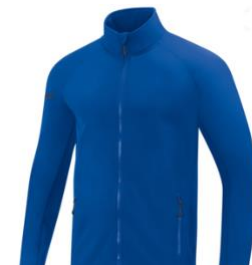
Team Sofshelljacke Artikel-Nr.: 7406 Farbe: royal