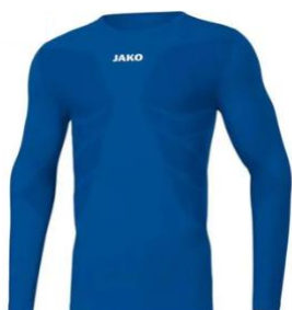
COMFORT Longsleeve recycelt Artikel-Nr.: 6456 Farbe: weiß; royal Größen: 116/128-164/176; S-XXL