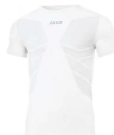
COMFORT 2.0 T-Shirt Artikel-Nr.: 6155 Farbe: weiß Größen: S-XXL