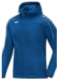
CLASSICO Kapuzenjacke Artikel-Nr.: 6850 Farbe: royal Größen: 128-164; S-4XL