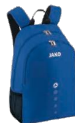
CLASSICO Rucksack Artikel-Nr.: 1850