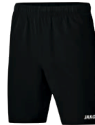
CLASSICO Shorts Artikel-Nr.: 6250 Farbe: schwarz Größen: 116-164 / S-4XL