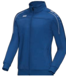
CLASSICO Polyesterjacke Artikel-Nr.: 9350 Farbe: royal Größen: 116-164; S-4XL