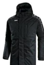
CLASSICO Coachjacke Artikel-Nr.: 7150 Farbe: royal; schwarz