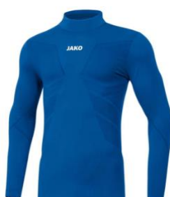
COMFORT 2.0 Turtleneck Artikel-Nr.: 6955 Farbe: weiß; royal Größen: 116/128-164/176; S-XXL