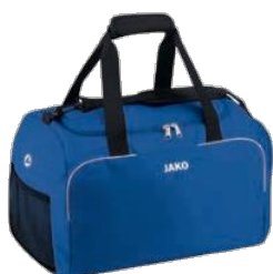
CLASSICO Tasche m. Seitenfach Artikel-Nr.: 1950