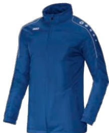
TEAM Allwetterjacke Artikel-Nr.: 7401 Farbe: royal